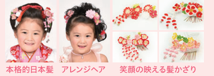
本格的日本髪 アレンジヘア 笑顔の映える髪ざり