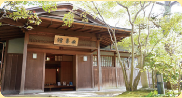
後期会場 燕喜館 (白山公園内)

七五三は無事成長したことを感謝し、将来の幸福と健康を願って神社におまいりするお祝い事です。