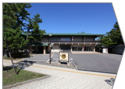
白山会館 無料駐車場