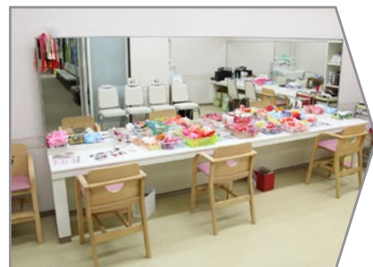
メイクルーム かわいらしい髪飾りもたくさんご用意しております。

お子様らしさを大切に自然なメイクです。 髪結・メイクが終わったら着付けルームへ。