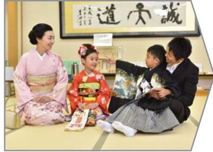
控室にて時間までおくつろぎ下さい。準備が整いましたら、ご案内致します。