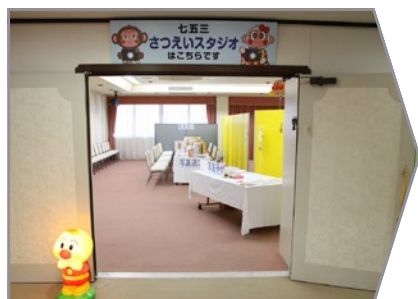
受付・着付ルームの前が撮影スタジオです。

プロのカメラマンがいくつかのポーズで撮影致します。おはらいが終わってから、お気に入りの写真を選んでいただきます。