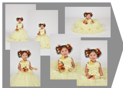
様々なポーズで撮影致します。