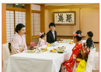
みんなで会食もできます。

衣裳返却の時間まで、境内、白山会館内、白山公園でのスナップ撮影をお楽しみください。 お出かけの際は、七五三コーナーにお声がけ下さい。