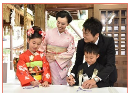
キティちゃんの絵馬に願い事を書きましょう。