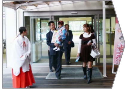
白山会館より徒歩1分で神社です。

白山会館から白山神社へ雨天の場合でも連絡通路より参拝できますので、天候を気にせずおまいりができます。