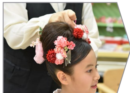
本格的な日本髪やアレンジヘアなどご希望をお伺いします。当日ご相談下さい。