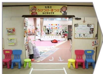
七五三受付と着付はこちらです。