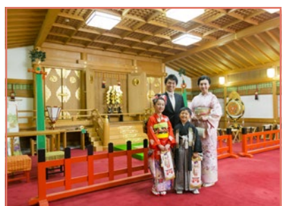
白山会館の中にある儀式殿(神社)で自由撮影して下さい。