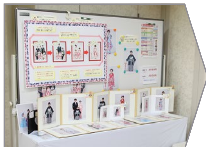
写真・CD-Rの仕上がりは約4週間かかります。