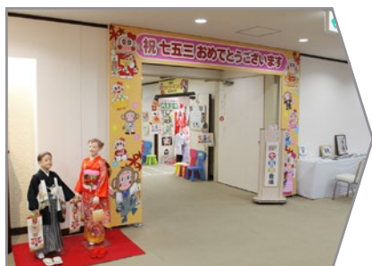
七五三コーナーへお越し下さい。