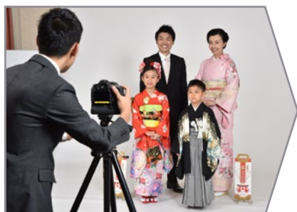
スタジオ撮影風景