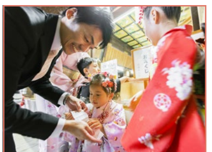
こどもおみくじもあります。