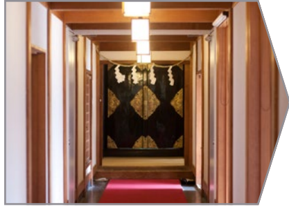
雨天の場合は、こちらの赤じゅうたんの連絡通路より神社へご案内致します。