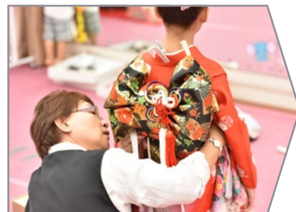
着付けのプロがきれいに着付け致します。