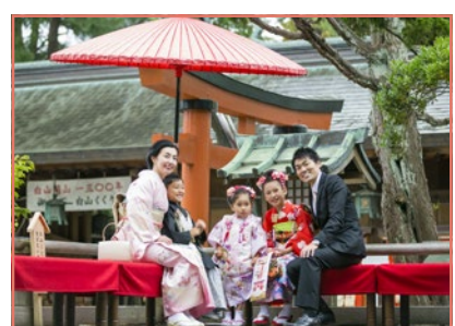
神社でたくさん撮影して下さい。