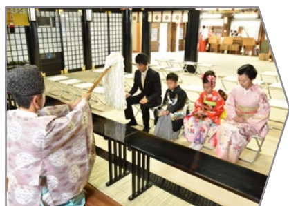
お清めのおはらい