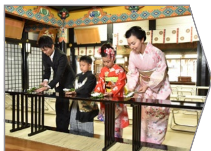
玉串をお供えしておまいりをします。