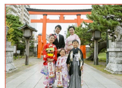
境内や公園で記念撮影。