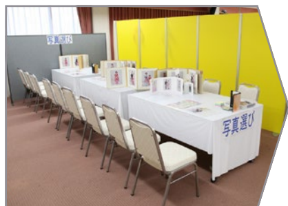
スタジオで写真選び。

スタジオに戻り、インデックスの中からお気に入りの写真をお選び下さい。 キーホルダーやカレンダーなどにもできます。 詳しくは当日係にお尋ね下さい(料金別途)。