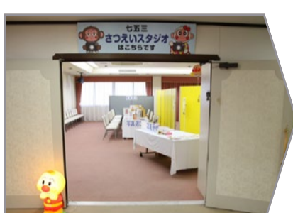
受付・着付ルームの前が撮影スタジオです。

プロのカメラマンがいくつかのポーズで撮影致します。おはらいが終わってから、お気に入りの写真を選んでいただきます。