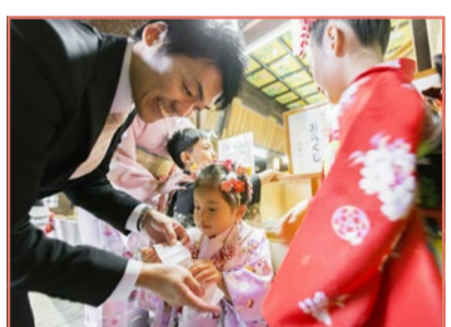
こどもおみくじもあります。