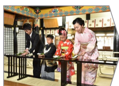
玉串をお供えしておまいりをします。