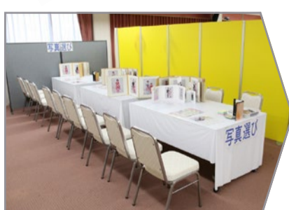
スタジオで写真選び。

スタジオに戻り、インデックスの中からお気に入りの写真をお選び下さい。キーホルダーやカレンダーなどにもできます。詳しくは当日係にお尋ね下さい(料金別途)。