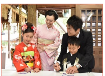
キティちゃんの絵馬に願い事を書きましょう。