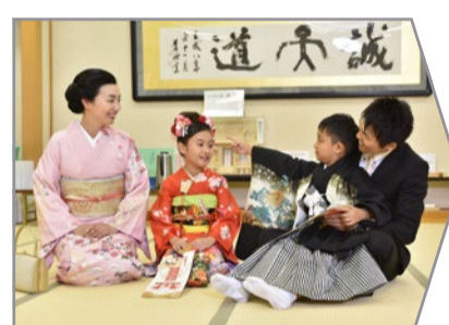
控室にて時間までお待つ下さい。準備が整いましたら、ご案内致します。