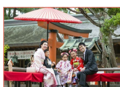
神社でたくさん撮影して下さい。