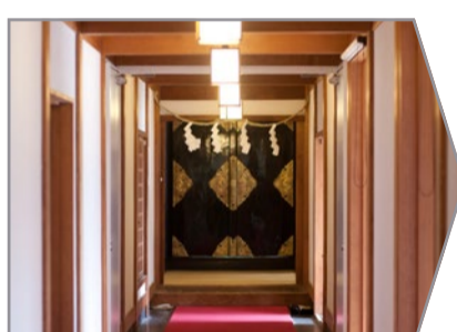
雨天の場合は、こちらの赤じゅうたんの連絡通路より神社へご案内致します。