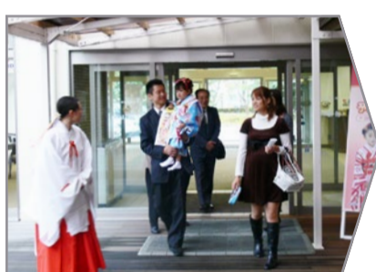
白山会館より徒歩1分で神社です。

白山会館から白山神社へ雨天の場合でも連絡通路より参拝できますので、天候を気にせずおまいりができます。