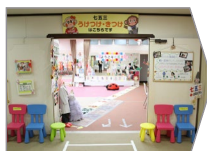
七五三受付と着付はこちらです。