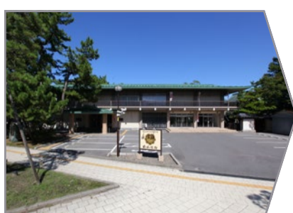
白山会館 無料駐車場