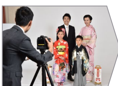
スタジオ撮影風景