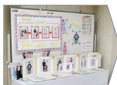
写真・CD-Rの仕上がりは約4週間かかります。