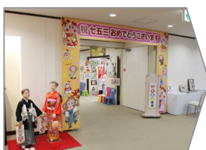
七五三コーナーへお越し下さい。