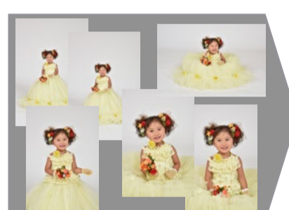
様々なポーズで撮影致します。