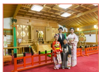
白山会館の中にある儀式殿(神社)で自由に撮影してください。