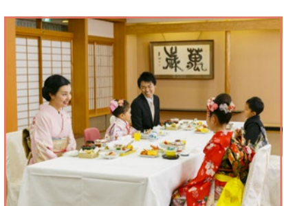
みんなで会食もできます。

衣裳返却の時間まで、境内、白山会館内、白山公園でのスナップ撮影をお楽しみください。お出かけの際は、七五三コーナーにお声がけ下さい。