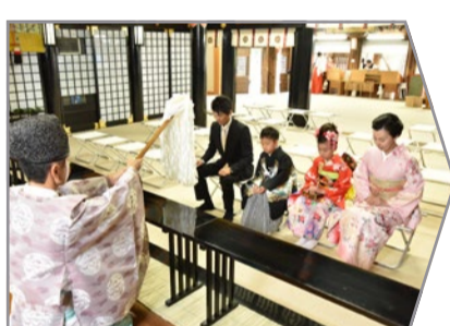
お清めのおはらい