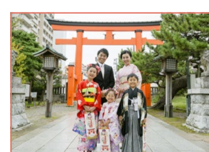
境内や公園で記念撮影。