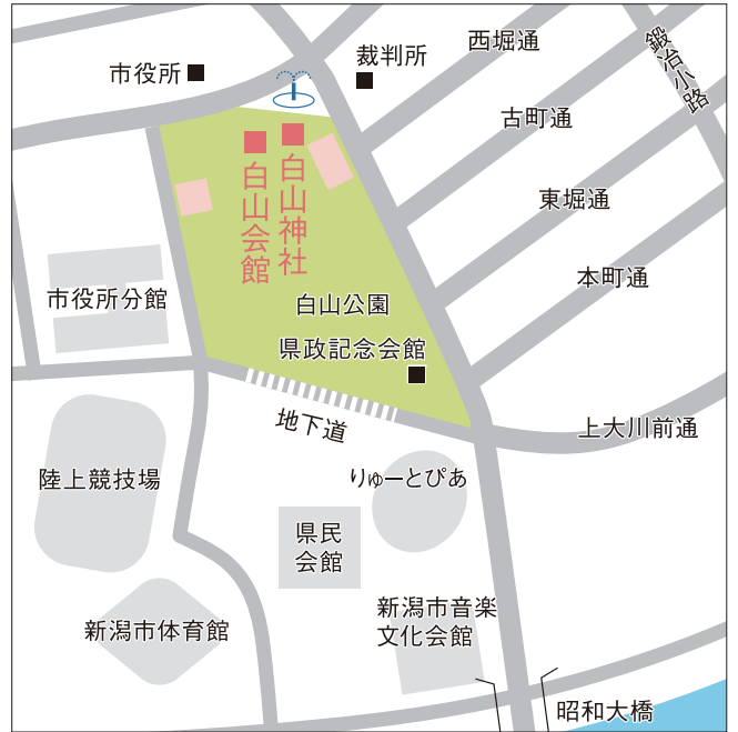
[ 神社周辺マップ ]